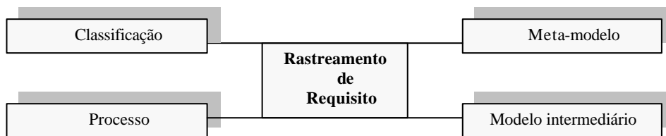
Fig. 1. Visão da Proposta para melhorar o rastreamento de requisitos

O objetivo deste artigo, é apresentar uma proposta que visa solucionar os problemas citados acima. A Figura 1 apresenta nossas quatro estratégias para melhorar o rastreamento de requisitos.